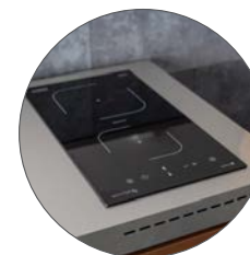
PLACA DE INDUCCIÓN