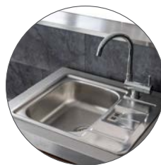
FREGADERO INCORPORADO CON GRIFO PLEGABLE