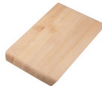
TABLA DE CORTAR - MADERA