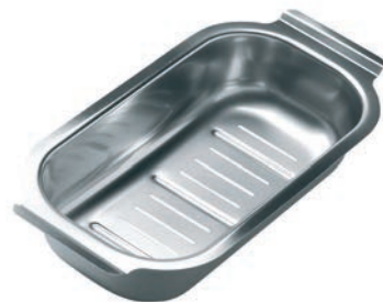
COLADOR PARA FREGADERO