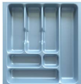
INSERTO DE CAJÓN